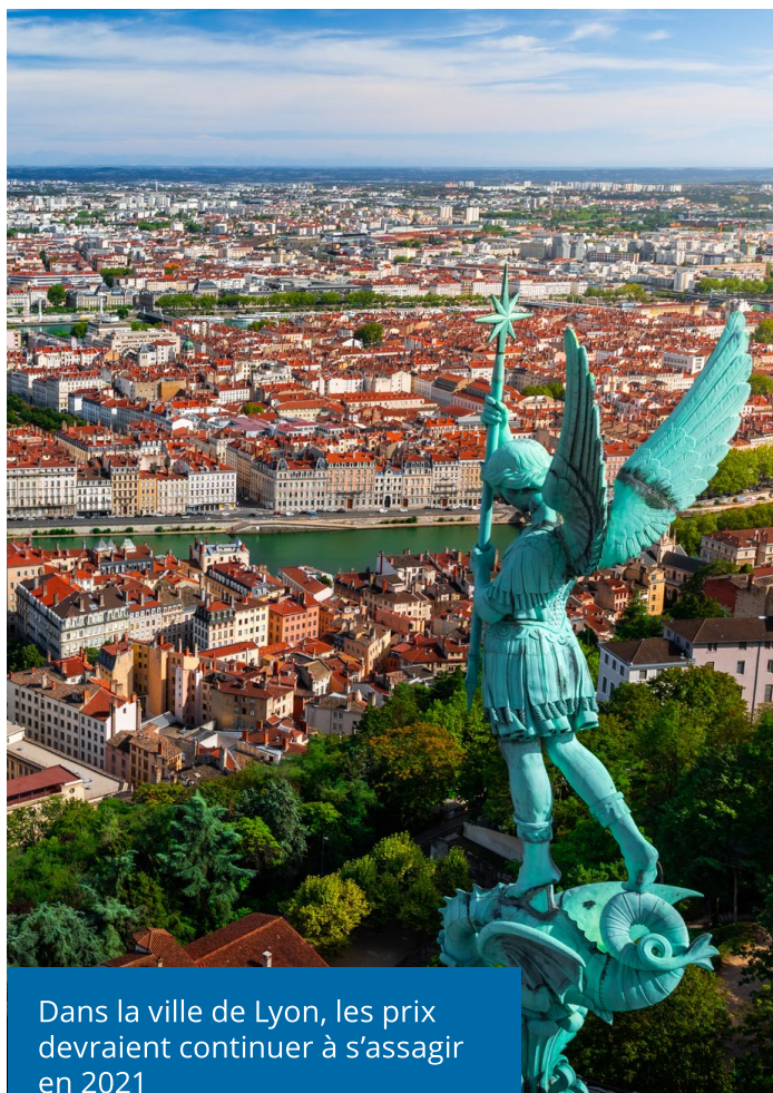
Dans la ville de Lyon, les prix devraient continuer à s'assagir en 2021